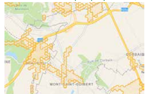
Zones nettoyées en 2019 par les équipes bénévoles

Pour plus d'informations www.walloniepluspropre.be